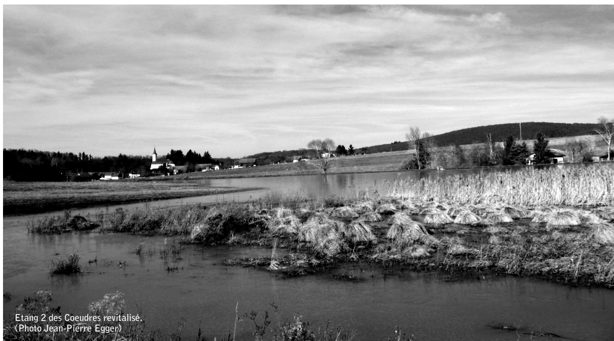
Etang 2 des Coeudres revitalisé.

En fonction de l'évolution de la menace décrite ci-dessus, la Fondation des Marais de Damphreux pourrait revendiquer un élargissement des zones tampon, la base légale est à portée de main.