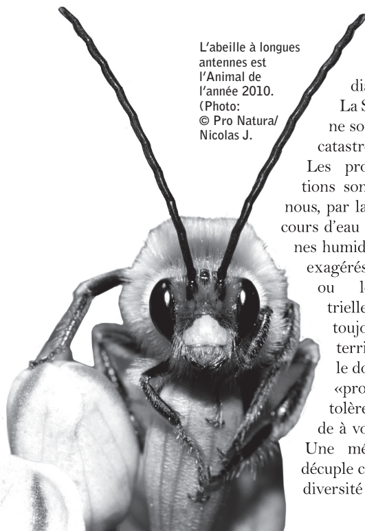
L'abeille à longues antennes est l'Animal de l'année 2010.

Si le chemin est long, il nous permet cependant de constater que de plus en plus de citoyens rejoignent notre combat. En 2009, Pro Natura Jura a connu une augmentation de 100 membres. Un encouragement formidable que nous souhaitons voir se poursuivre.