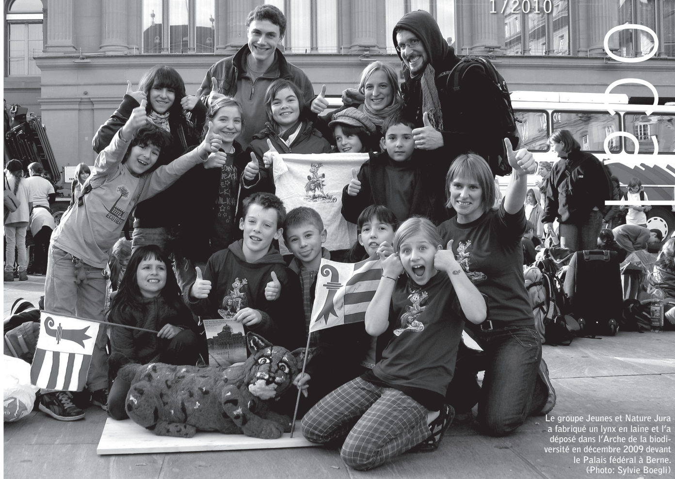
Le groupe Jeunes et Nature Jura a fabriqué un lynx en laine et l'a déposé dans l'Arche de la biodiversité en décembre 2009 devant le Palais fédéral à Berne.