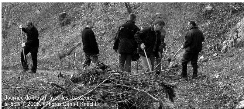
Journée de travail avec les chasseurs le 5 avril 2008. (Photos Daniel Knecht)

Projet papillons pour favoriser la biodiversité dans les pâturages et les forêts