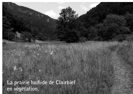
La prairie humide de Clairbief en végétation.

Ce mode d'exploitation agricole, plus extensif, fait partie du plan de gestion de la réserve naturelle de Pro Natura à Clairbief. Cela est basé sur le rapport rendu en 2008 par une équipe de biologistes qui dressait la liste des nombreu-