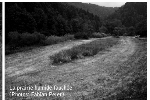
La prairie humide fauchée

ses espèces et milieux dans le secteur et celui de Masesselin. En cours de réalisation, ce plan a pour objectifs d'établir un calendrier des mesures d'entretien et indications visant à préserver et promouvoir la biodiversité sur le site. Le document comprendra des fiches de gestion des milieux qui seront utilisables par l'exploitant, M. Barth. Pour