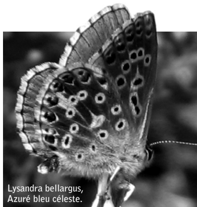
Lysandra bellargus, Azuré bleu céleste.