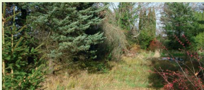
Le site avant les travaux.