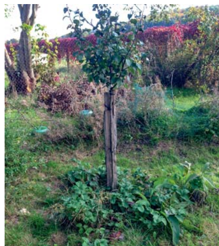
La permaculture est l'association de plantes qui coopèrent.