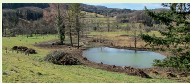
Le site après les travaux.