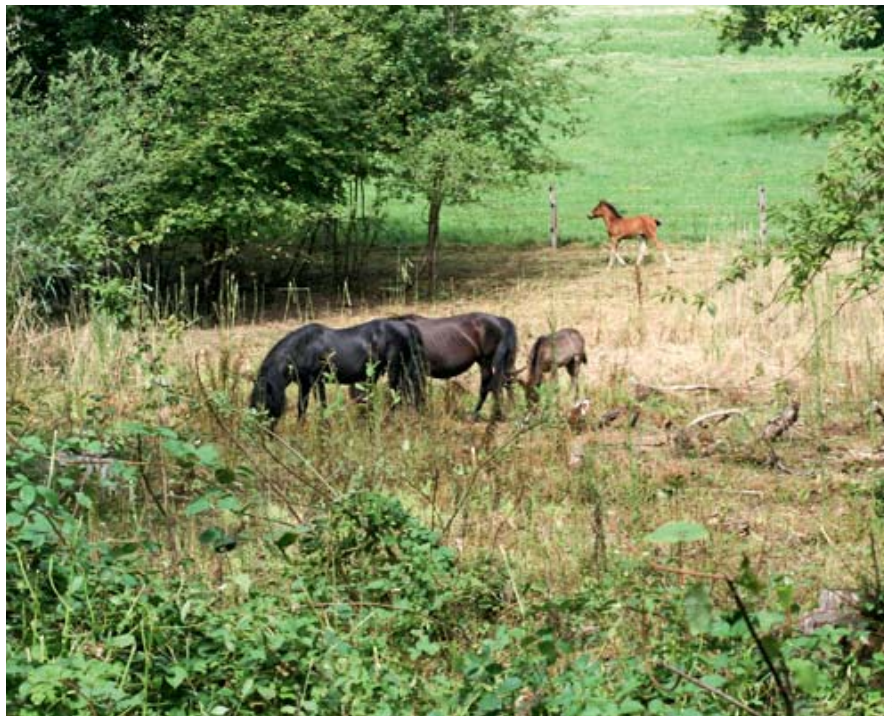
Les chevaux Pottoks entretiennent les zones humides autour des étangs.

À Damphreux sur le site des Coeudres, autre site d'importance nationale pour les batraciens, la baisse du niveau d'eau a été favorable pour la Bergeronnette grise, ainsi que différents limicoles de passage. Pour assurer un milieu ouvert et contenir une végétation généreuse, des vaches rustiques et légères et des Pottoks ont pâturé dans