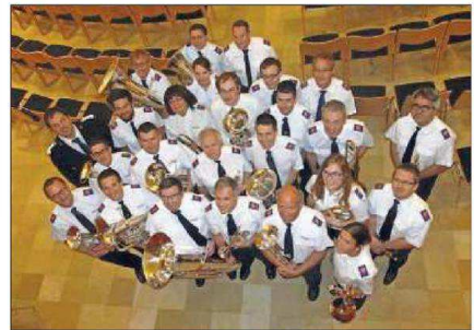
Le Brass of Praise, fanfare nationale de l'Armée du Salut en Suisse, donnera un concert à Montfaucon samedi à 20 heures.

Les cuivres envahiront la halle polyvalente de Montfaucon samedi soir. En effet, le Brass of Praise, fanfare nationale de l'Armée du Salut en Suisse, y animera un concert intitulé Kingdom.