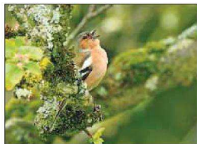
La découverte du chant des oiseaux est au programme de la Fête de la Nature. Ici un pinson des arbres.

Au programme: approche du cheval, balade à la découverte des champignons de printemps, marché d'échanges de plantons, de graines, de semences et d'outils de jardinage, autoconstruction de panneaux solaires thermiques, atelier de fabrication de produits ménagers naturels ou encore mandala permaculturel pour les enfants.