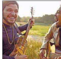
The Two vendredi à Moutier.

Les deux musiciens tirent leurs forces des racines du