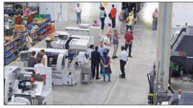
Schaublin Machines avait inauguré ses nouveaux locaux en 2013.

Mais si Schaublin Machines a été fortement fragilisée en raison d'une succession de coups durs dès 2008 (avec la crise des subprimes d'abord, puis l'apparition de problèmes géostratégiques avec la Russie, acteur important du marché,