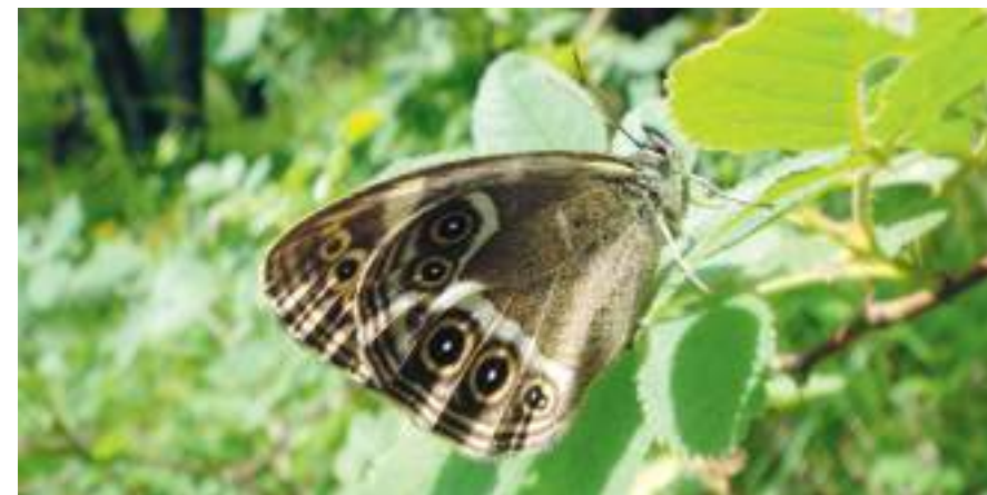
Le papillon Bacchante dans la réserve de Clairbief.

Les inventaires portant sur la faune et la flore seront affinés et pourraient apporter de belles découvertes. Des objectifs de gestion seront précisés dans les prochains mois. MT