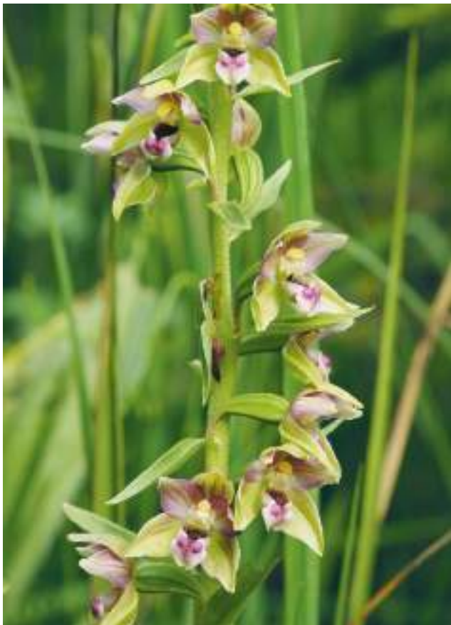
Epipactis helleborine dans le bas-marais des Embreux.