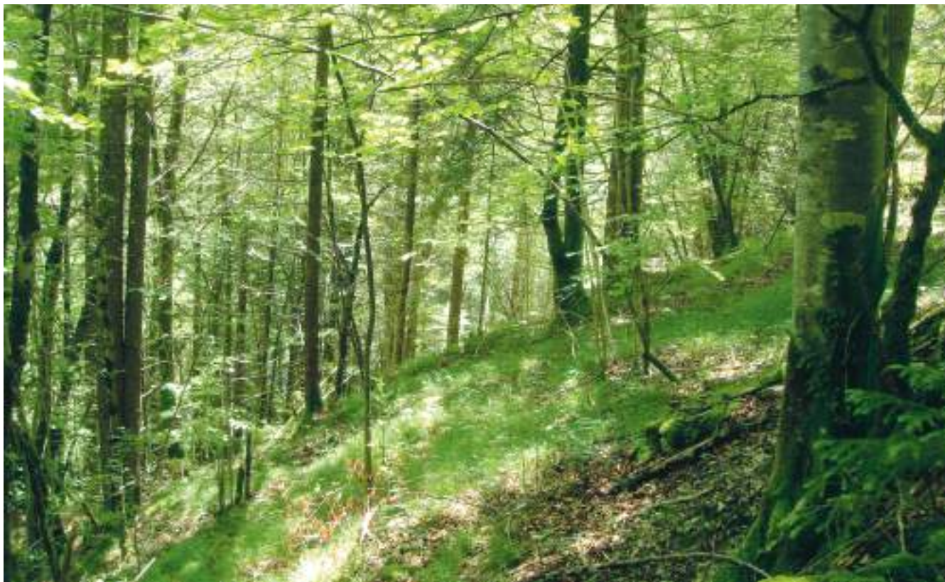
La hêtraie thermophile constitue l'habitat de prédilection de plusieurs espèces rares comme le papillon Bacchante.

Ce printemps, Pro Natura Jura a pu acquérir un domaine de 34 ha de forêt, attenant à la réserve de Clairbief, au lieu-dit Côte à l'Aigle, créant ainsi un espace protégé de 47 ha d'un seul tenant.