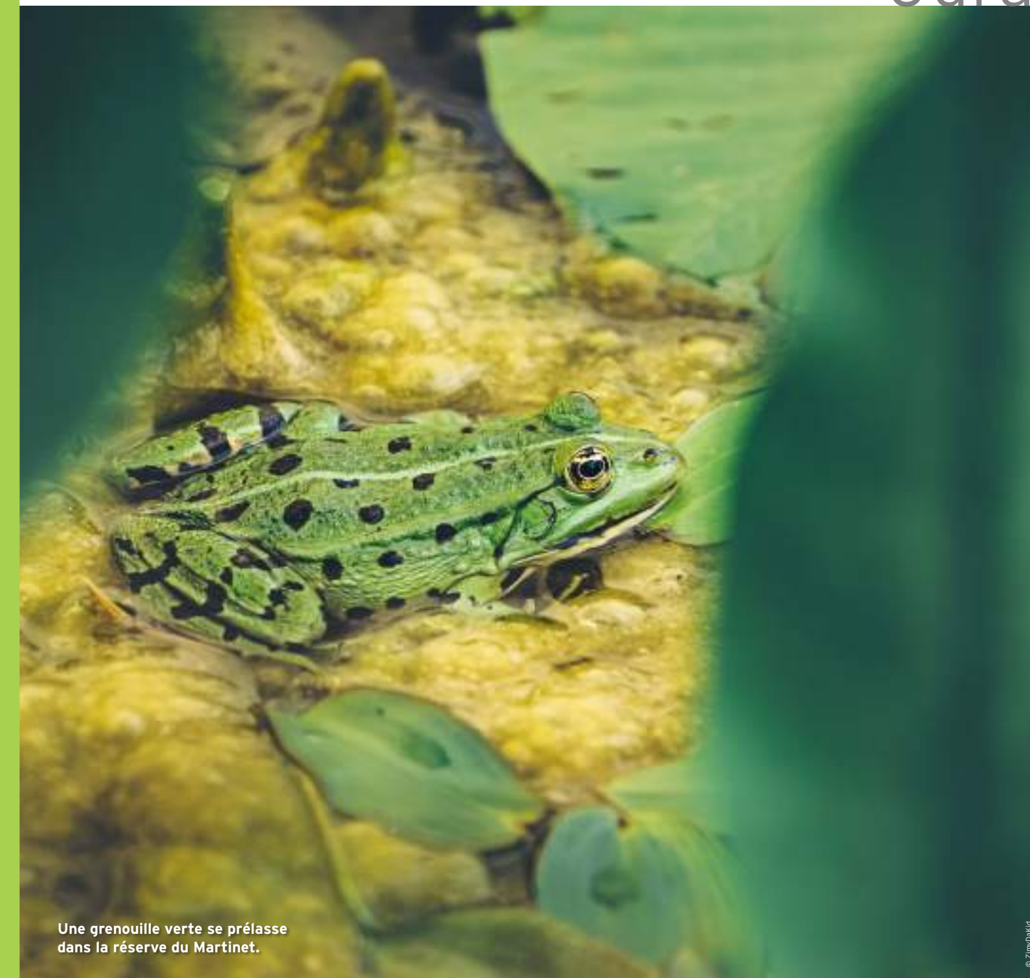
Une grenouille verte se prélassé dans la réserve du Martinet.