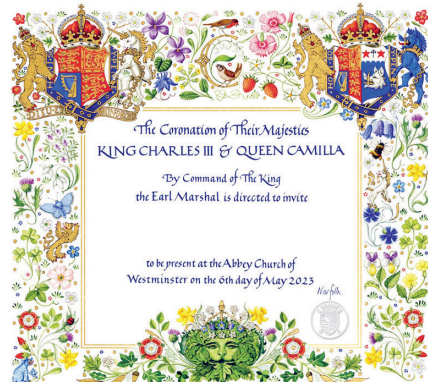
Invitation au couronnement de Charles III.

Un clin d'œil à la très jolie et naturaliste invitation de Charles III à son couronnement.