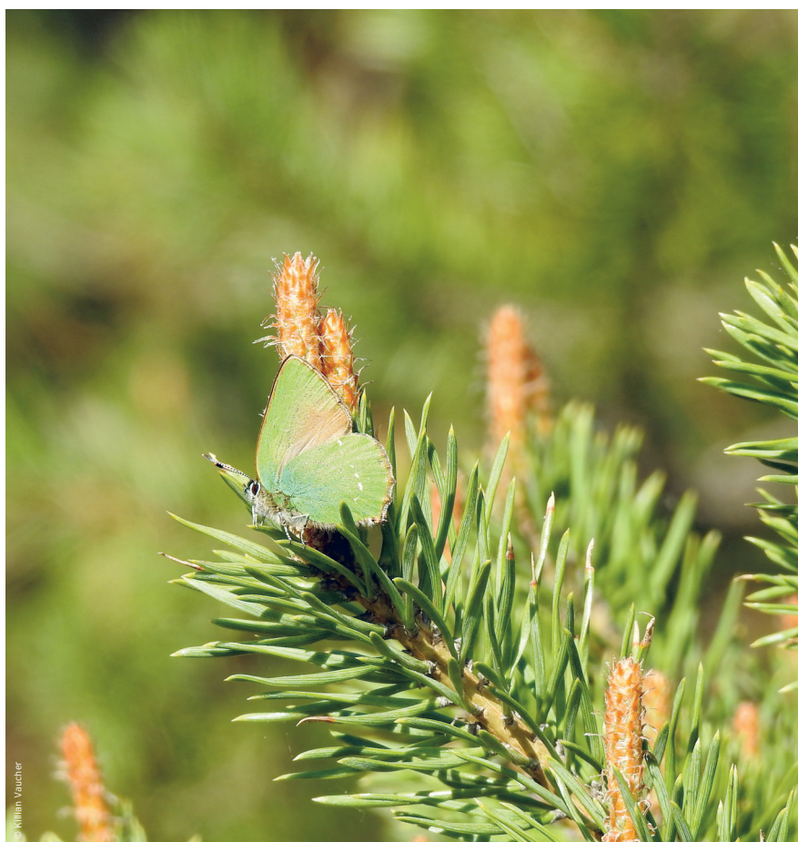
La Thècle de la ronce ( Callophrys rubi ).