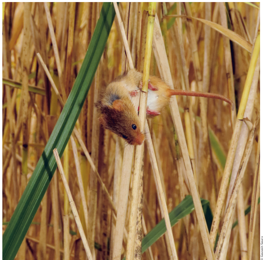
La Souris (ou Rat) des moissons ( Micromys minutus ).