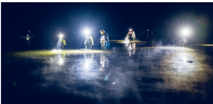
Recherche nocturne à la lampe.