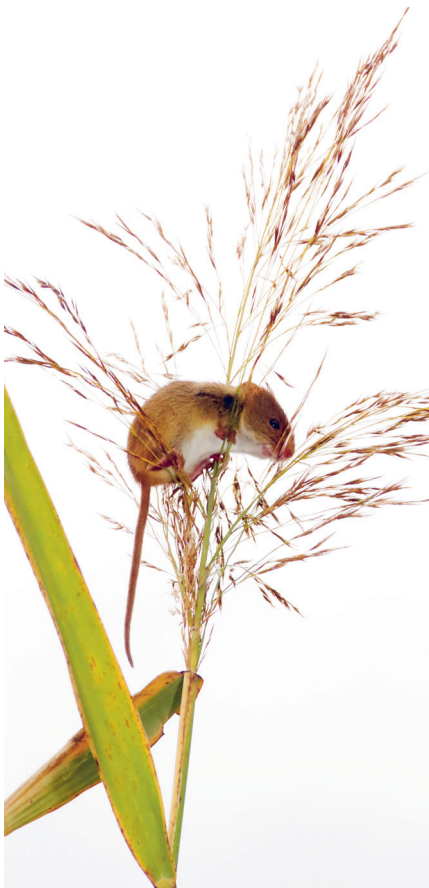
La Souris des moissons.