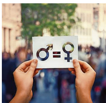
Le thème de l'égalité est au cœur des écoles jurassiennes depuis une année.

Tout au long de l'année scolaire, chaque établissement jurassien s'est vu proposer différentes ressources pour mettre en place des formations spécifiques adaptées à leurs besoins. Divers projets ont vu, ou verront le jour, tels que des leçons et activités sur le thème de l'école de l'égalité, des activités et débats sur les stéréotypes, une semaine dédiée à l'égalité, une démarche autour des métiers, un théâtre forum