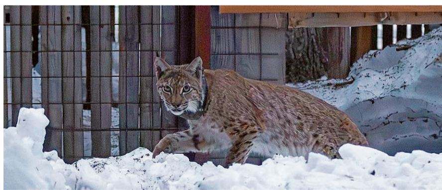
Margy, lynx jurassien femelle de 2 ans capturée à Courtételle en mars 2023 et relâchée dans le nord de l'Italie, est en pleine santé.

Pour Pro Natura Jura, «la capture régulière de lynx jurassiens renforce inutilement cette diminution de diversité génétique. L'association juge donc opportun de compenser la capture-relocalisation d'un animal jurassien par l'arrivée d'un autre spécimen d'origine est-européenne. Le maintien d'une population de lynx viable et, par conséquent, le contrôle de l'abrutissement par le chevreuil et le chamois, l'imposent. Ce sont nos forêts qui en sortiront plus fortes.»